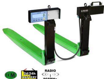
Gabelzinken-Waage mit LCD-Anzeige