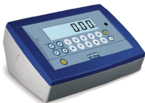
Anzeige in der Kabine