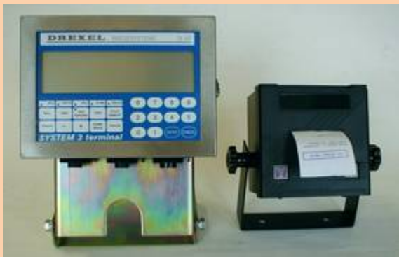
Anzeige DI-47-RS/PA mit Drucker

In vielen Einsätzen ist es erforderlich, die vorgenommenen Wägungen zu dokumentieren. Zu diesem Zweck ist das